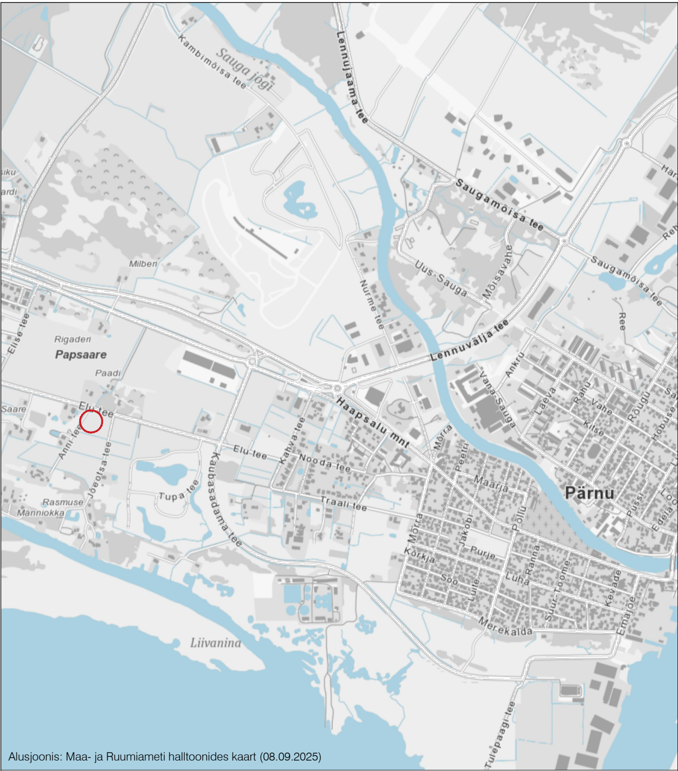
Alusjoonis: Maa- ja Ruumiameti halltoonides kaart (08.09.2025)